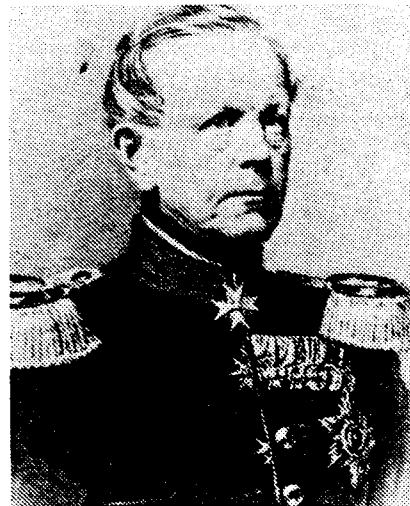
Helmuth Graf Moltke, 1870/71 Generalfeldmarschall. Er war der unscheinbare Mann, der in einer Mietkutsche zur Front fuhr.

Eine musikalische Reunion vereinigte noch lange in der Wirtschaft Einheimische und Auswärtige zu heiterer Geselligkeit. Das ganze Fest wurde durch keinen Mißton gestört; es war in seinem ganzen Verlauf ein echtes Friedensfest."